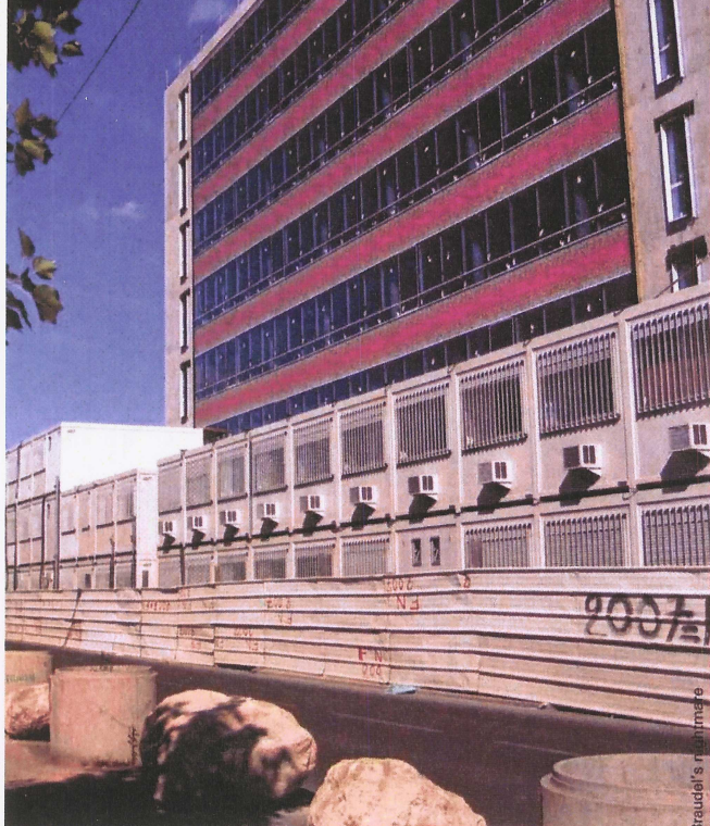
« Parcelle 521 » : un des bâtiments qui pourraient accueillir l'EPHE, l'EHESS et la MSH, en attendant la création de la Cité internationale des humanités et des sciences sociales .

pôle scientifique en sciences humaines et sociales au nord de Paris pour un montant estimé à 65 millions d'euros par le Contrat de Plan Etat Région 2007-2013.